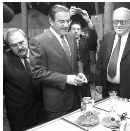
Imagen de la inauguración del stand del CTA en la Semana de la Ciencia

El stand del Centro sirvió también como escenario para demostraciones tecnológicas relacionadas con la artesanía, tales como la del robot tallador de vidrio, presentado en la anterior edición de la Semana de la Ciencia, pero que volvió a atraer la atención de numerosos ciudadanos.