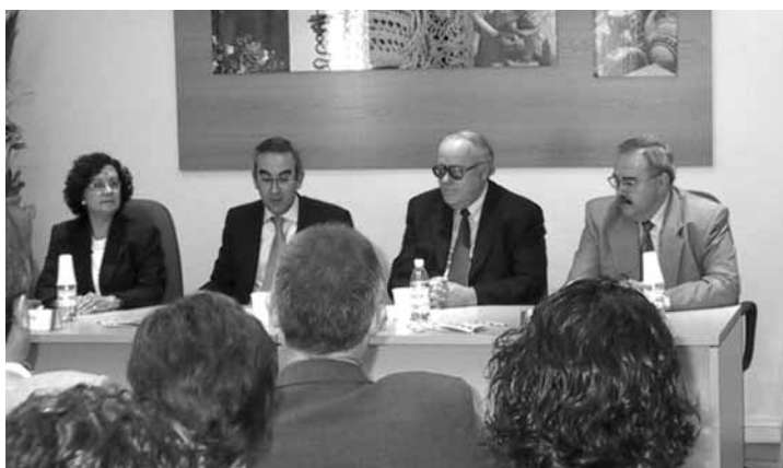
Momento de la presentación del III Foro de Innovación organizado por el CTA

Este mismo escenario permitió también a los responsables del CTA presentar los primeros resultados de sus investigaciones sobre las arcillas elaboradas con residuos de mármol, un estudio realizado conjuntamente con el Centro Tecnológico del Mármol.