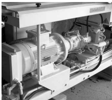
Maquinaria innovadora para la artesanía

En lo que a la cuarta línea de acción se refiere, cuyo título técnico es 'Introducción