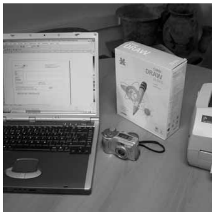
Nuevas herramientas de calidad y diseño

Un total de cuatro empresas se han acogido a una tercera línea, sobre 'Transferencia de tecnología', que ha permitido la incor-